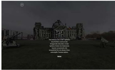
Abb. 3: Einstiegstutorial des Projekts 3. In: Nach Berlin. 75 Jahre Kriegsende. [Kulturprojekte Berlin (Hg.) 2020]

Zusammenfassung: Eine Hilfeseite, die den Nutzer*innen die Bedienung und Hauptfunktionen der Anwendung verständlich und kurz erläutert, ist obligatorisch für VEs der Domäne Museum, da so auch die Zugänglichkeit erleichtert wird. Diese Hilfestellung sollte schnell zu finden sein, beispielsweise über das Menü oder über einen Button, der direkt zur Hilfeseite führt. Mithilfe unterschiedlich gestalteter Buttons kann signalisiert werden, dass unterschiedliche Interaktionsmöglichkeiten zur Verfügung stehen. Durch ein unauffälliges Design stören sie die Nutzer*innen nicht in der Exploration des VE, machen aber durch ihre Dynamik, beispielsweise der Veränderung ihrer Größe, auf sich aufmerksam. Weiterhin wird den Nutzer*innen auf diese Weise verdeutlicht, dass nur bestimmte Objekte die Möglichkeit einer Interaktion bieten.