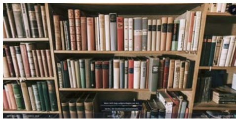
Abb. 4: Beispiel für Multimedialität in Projekt 1. In: Zeitkapsel. [WDR (Hg.) 2018]

Im Rahmen der Betrachtung von Heuristik 2 ( Compatibility with the user's task and domain ) wurden einige multimediale Elemente innerhalb der Projekte bereits beschrieben. Allerdings beschränkten sich die Beispiele, die als Best Practices angeführt wurden, auf multimediale Bestandteile der Projekte, welche Elemente einer realen Ausstellung imitieren. In den Projekten finden sich jedoch beispielsweise Audiosequenzen oder Videos, die in anderer Weise, wie es im realen Museum so nicht möglich wäre, präsentiert werden. Deggim et al. sehen die »große Stärke [von virtuellen Museen] in der ergänzenden Präsentation [...], die mit klassischen Ausstellungsmethoden nicht möglich [ist]«. 54 Ansätze dazu finden sich auch in den betrachteten Projekten. In Projekt 1 haben die Nutzer*innen im Szenario 1968 – Schöner Wohnen die Möglichkeit, ein Bücherregal im Wohnzimmer, in dem sie sich befinden, genauer zu untersuchen. Fahren sie mit der Maus über das Regal, werden ausgewählte Bücher ein Stück weit aus dem Regal hinausgezogen und ein kurzer Auszug aus dem Buch vorgelesen. Bei den Büchern handelt es sich um Werke, die um die entsprechende Zeit veröffentlicht wurden, beispielsweise das Buch Deutschstunde von Siegfried Lenz aus dem Jahr 1968 (vgl. Abbildung 4).